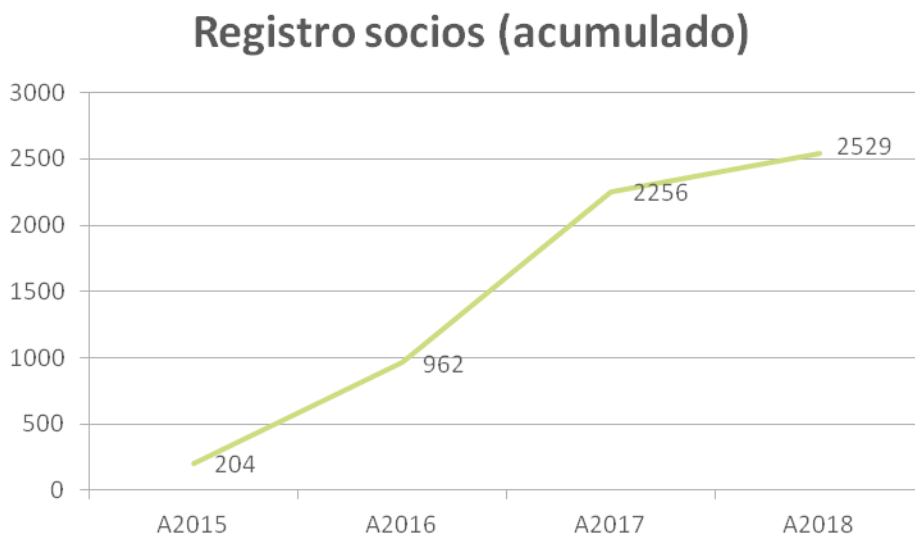
Gráfico 4. Solicitudes de registro por año (aprobadas y vigentes)