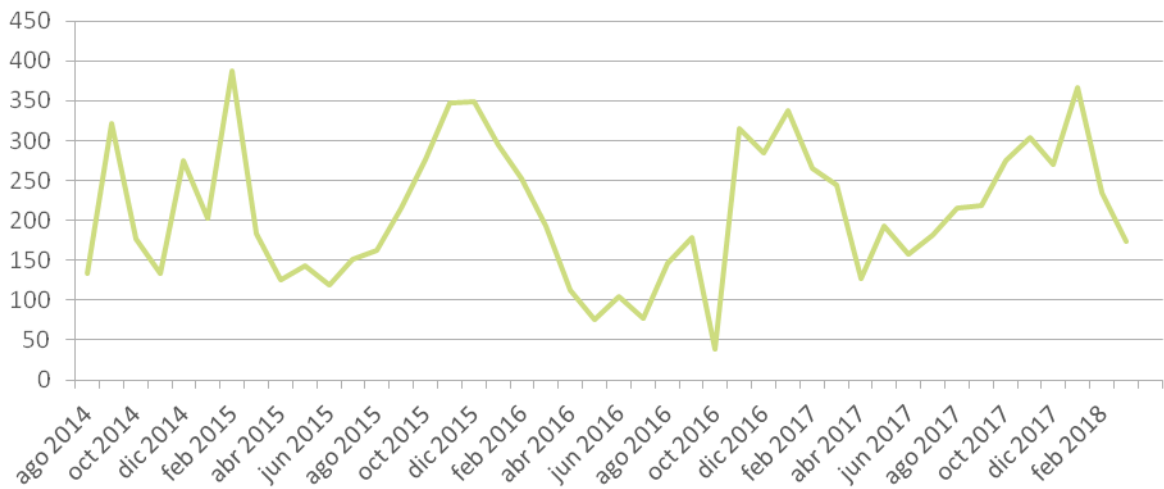
Gráfico 2. Registros por mes de autocultivadores